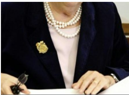
Il ministro Cancellieri

continueremo a dirlo»: sono le parole del ministro dell'Interno Annamaria Cancellieri. Parlando con i giornalisti a Casalecchio di Reno, alle porte di Bologna, dove ha partecipato a un'iniziativa della rassegna Politicamente scorretto , la Cancellieri ha detto che «i risultati si vedono, l'impegno c'è: si sta lavorando molto bene».