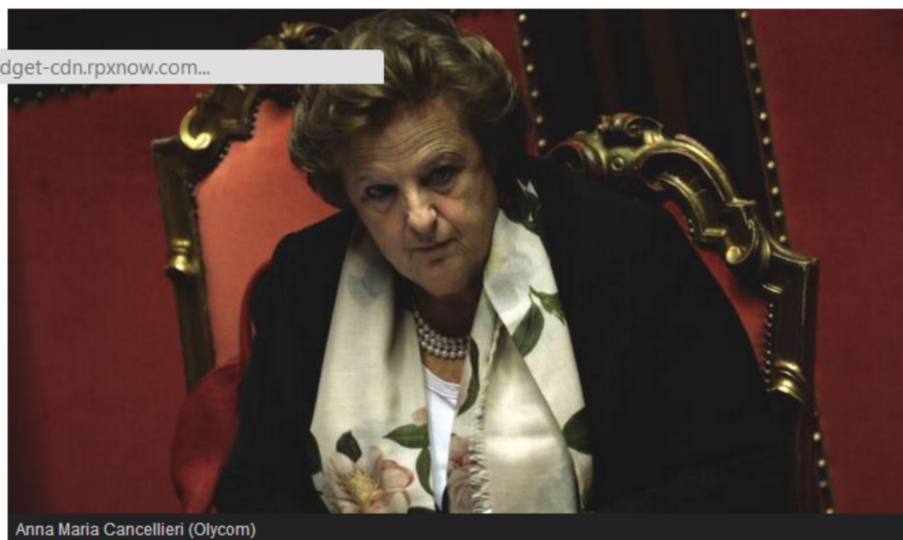
Anna Maria Cancellieri

Corruzione, il ministro dell'Interno, Cancellieri: "Il provvedimento è un segnale forte ma serve un appello alla politica". Sulle manifestazioni: "Processo lungo l'identificabilità degli agenti. Serve rispetto reciproco. Sabato ha vinto la democrazia"