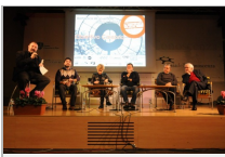
Politicamente Scorretto - Foto a cura di Libera Radio

Legalità, mafie e corruzione. Ma anche antimafia, amministratori pubblici impegnati su territori difficili, giornalisti che raccontano storie scomode. Inchieste su mafie al Nord. Questo e molto altro, dal 19 al 25 novembre a Bologna, all'ottava edizione di "Politicamente Scorretto". La settimana che si è appena conclusa è stata l'occasione per affrontare con i diversi linguaggi della letteratura, del cinema e del teatro questi temi centrali per la democrazia nel nostro Paese. 32 appuntamenti hanno dato vita all'iniziativa ideata da Carlo Lucarelli, cui hanno partecipato più di 60 ospiti. Una